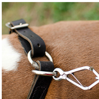
Collier étrangleur en cuir avec deux types de montage