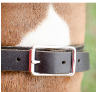
Collier chien étrangleur taille réglable